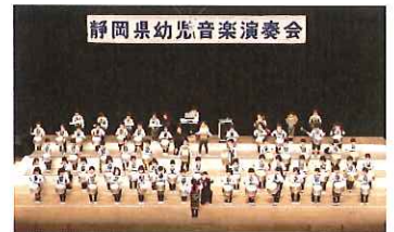
静岡県幼児音楽演奏会

友達より私が一番と思っている子の音は、強く一人よがりの音です。自信がない子の音は、弱く役割を果たしません。一人ひとりが自分に自信を持てるように、毎日少しずつ練習します。友達の音を聞いて自分の音を出せるようになるのには、時間がかかります。人間関係が成熟していかないと、全体の音は深まりません。毎日の遊び、運動会、キャンプ、様々なことを通して、友達の良さを知ったり、自分の良さを知ったりして、それが不思議と音に現れてくるんですね。