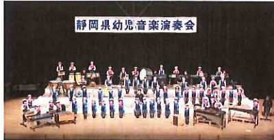
静岡県幼児音楽演奏会

心と音の合わせっこ 大成功!! 「友達とつながる事の楽しさ、難しさ、素晴らしさ」を感じて