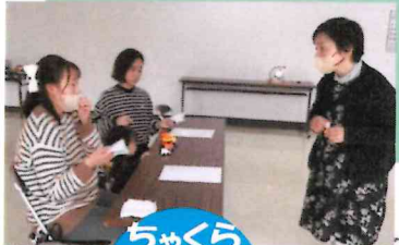
ちゃくら de アロマ