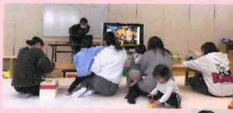
ゲームも 楽しんでいます