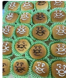
アンパンマンパン