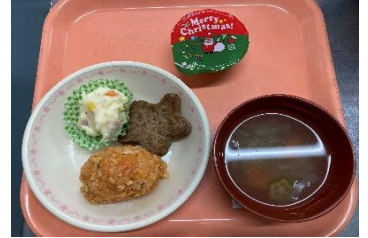
ハッピーホリデーランチ