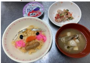
アンパンマンランチ