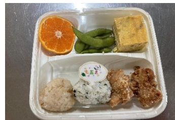
七五三お祝いランチ