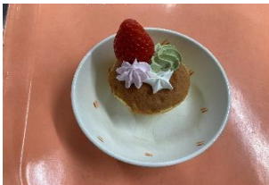
ハッピーホリデーケーキ