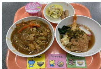
新春うどん屋さん