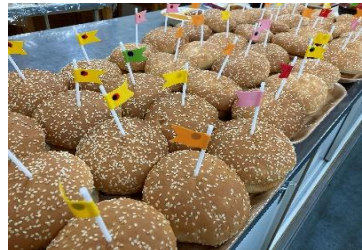
こいのぼいランチ